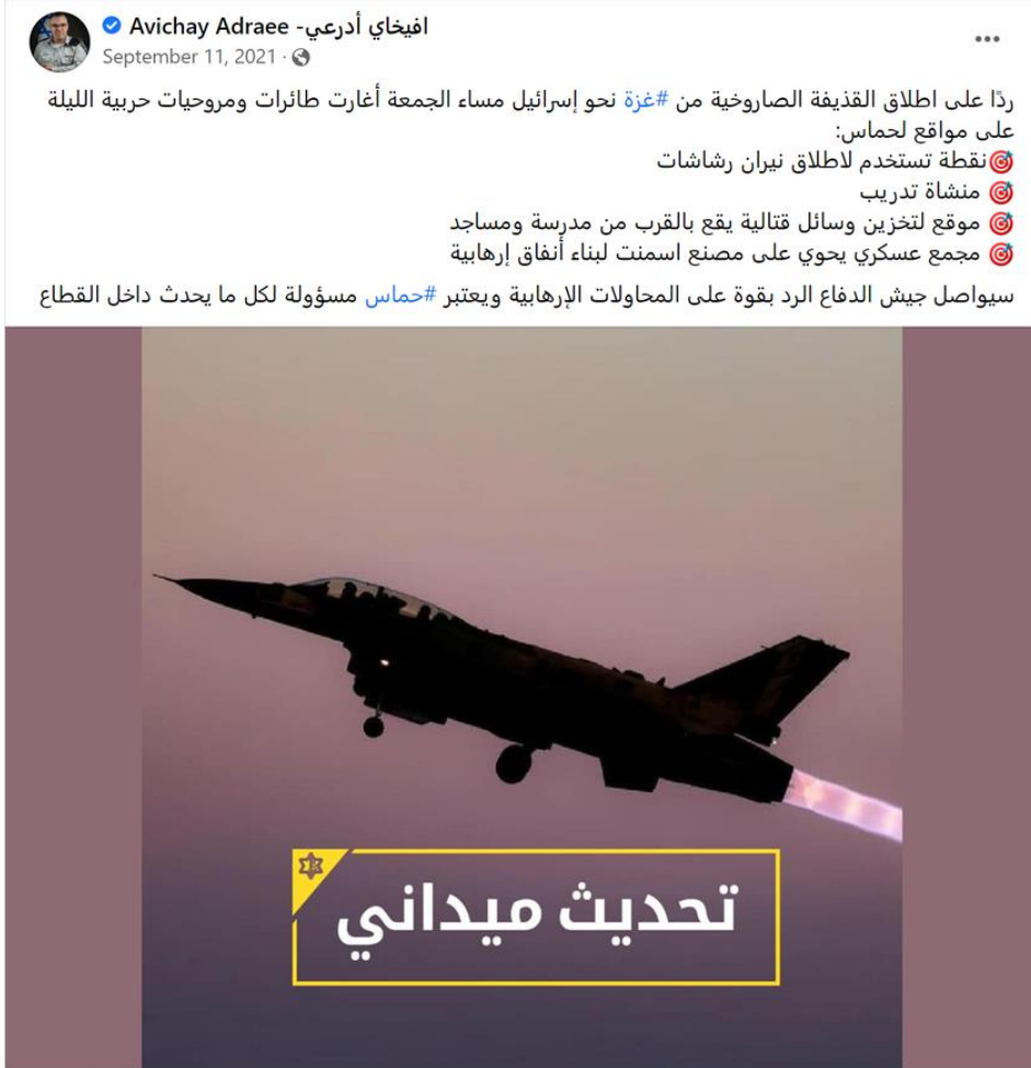
صورة (6): منشور لأدري بتاريخ 11 أيلول 2021، كمثل على إطار المسؤولية.

تبعاً لإطار الصراع وإطار المسؤولية ركزت صفحة "أفيخاي أدري" على تشويه صورة فصائل المقاومة الفلسطينية نتيجة لموقفها الداعم للأسرى الستة، فأطلق "أدري" على قطاع غزة "الإرهاب الغزاوي" و"غزة الظالمة"، وألقى اللوم على حماس في الحرب تبعاً لإطار المسؤولية، وإظهار حكومة الاحتلال في جهة مدافع من خلال انتقاء كلمات مثل "رد" "اعتداءات". أنظر صورة رقم (6) والتي تمثل إطار المسؤولية، حيث يعمل من خلاله "أدري" على تحميل حركة حماس بالكامل لكل ما يحدث لقطاع غزة من حروب ودمار وإغلاق.