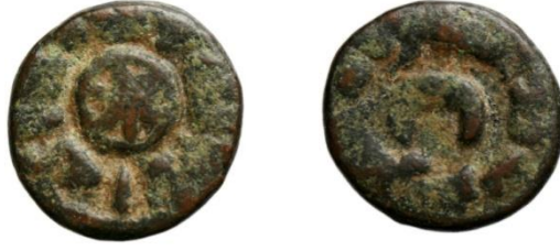
شكل (10): http://hcr.ashmus.ox.ac.uk/coin/hcr10753