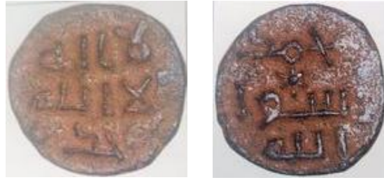
شكل (9): القسوس، 2004: 449.

وقد سجل الدكتور نايف القسوس هذا الفلس في مؤلفه القيم عن النميات النحاسية الأموية ضمن الفلوس التي شهدت أخطاء إملائية، وقال بأن حرف الواو في (وحده) جاءت غير مكتملة، على شكل (9)، بينما جاءت طباعة حرفي (لا) في السطر الأول مختلفة عنها في السطر الثاني في مآثورات وجه المسكوكة (القسوس، 2004، ص 449).