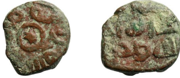
شكل (3): https://hcr.ashmus.ox.ac.uk/coin/hcr10418

يلاحظ أن كلمتي (بسم الله) في مركز الوجه غير واضحة، وهي مأخوذة من القراءة التي قدمها متحف الأشمووليان نقلاً عن عالم النميات John Walker (1956, p.329).