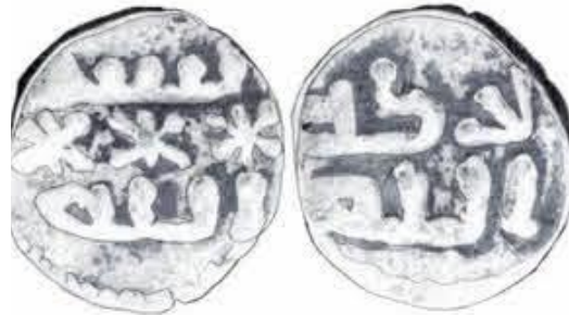
شكل (4): file:///C:/Users/ac/Downloads/Dialnet-

مع أن هناك من علماء النميات مثل (Karabacek) قد قرأ الظهر (الزكاة لله) وقال بوجود أخطاء إملائية في النقش، بل أنه رجح أن يكون دار ضربه مدينة في شمال أفريقيا (Karabacek, 1877, pp. 356-359).