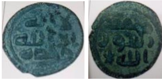
شكل (8): القسوس، 2004: 309.