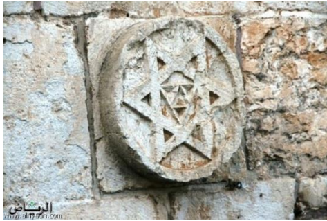
شكل (د): سور القدس العثماني https://www.alriyadh.com/590057