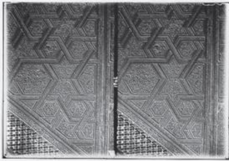
شكل (ج): منبر المسجد الإبراهيمي https://www.marefa.org/%D8%A7%D9%84%D8%AD%D8%B1%D9%85%D8%A7%D9%84%D8%A7%D8%A8%D8%B1%D8%A7%D9%87%D9%8A%D9%85%D9%8A

أما في مجال النميات فقد نقش المسلمون النجمة السداسية على نقودهم في كل العصور الإسلامية منذ العصر الراشدي وحتى العصر العثماني.