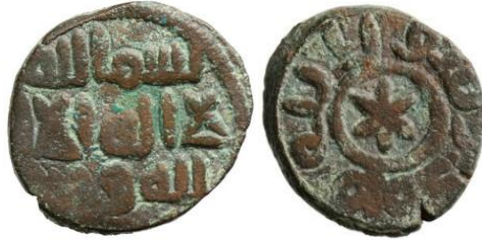
شكل (1): http://hcr.ashmus.ox.ac.uk/coin/hcr10686