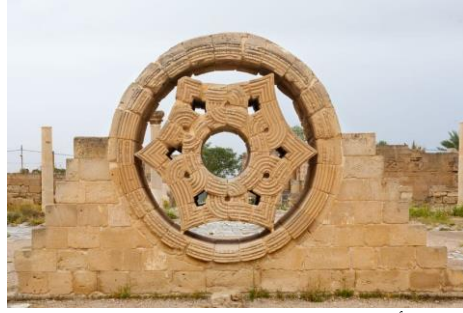
شكل (أ): شباك قصر هشام في فلسطين https://dalilsafar.com/travel-directory/%D9%82%D8%B5%D8%B1%D9%87%D8%B4%D8%A7%D9%85