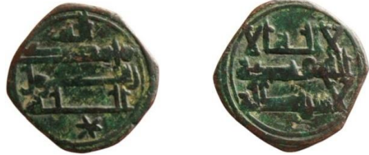
شكل (14): http://hcr.ashmus.ox.ac.uk/coin/hcr11886

تبدو حروف الألف في هذا الفلوس تنتهي بنصف ورقة، من باب زخرف الخط الكوفي، فيما عُرف لاحقاً بالكوفي المورق. وهذا الخط لم يُعرف قبل العصر العباسي، ولكن مايلز في كتابه The coinage of the Umayyads of Spain صنف هذا الفلوس بأنه أموي من ضرب الأندلس (Miles, 1950, p.179)، ويؤيد الباحث ما قام به مايلز من نسبة هذا الفلوس إلى الأمويين، حيث أن العباسيون لم يحكموا الأندلس، وبالتالي أمتد حكم الأمويين في الأندلس حتى بعد سقوط دولتهم في 132 هـ/750 م في المشرق.