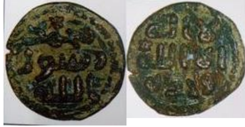
شكل (7): القسوس، 2004: 297.

جاءت النجمة السداسية على وجه القطعة فوق حرف الهاء في كلمة الله، في مكان غير بارز، بينما جاءت في مكان بارز في أعلى مركز الظهر، وهي من الحالات القليلة التي نجد فيها النجمة السداسية منقوشة على القطعة أكثر من مرة.