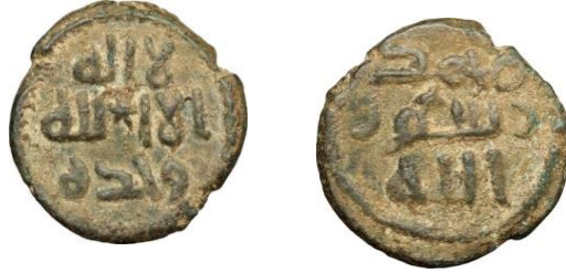
شكل (5): https://www.deamoneta.com/en/auctions/view/690/591 الوزن 3.26غم ، القطر 18.5 ملم

ويلاحظ على هذا الفلس أنه لا يحمل أسم دار الضرب، مع أن جون ووكر – عالم النميات المعروف- قد نشره برقم 790، ونسبه إلى مدينة دمشق، ربما بسبب شكل وأسلوب الخط الكوفي (Walker, 1956, No790). وقد نقشت النجمة السداسية في مركز القطعة تماماً دون مراعاة للنصوص التي يحملها وجه القطعة، حتى أنها قسمت لفظ الجلالة إلى نصفين كما يظهر في الصورة المرفقة. أما ظهر القطعة فقد حمل نقش يشبه الصليب فوق حرف السين في كلمة (رسول). ونظراً لقلّة وزن هذا الفلس البالغ (3.26غم) وقطره يساوي 18.50ملم؛ فمن الراجح أن هذا الفلس أموي وليس عباسي، ذلك أن الفلوس العباسية في الغالب أكثر وزناً وأوسع قطراً من الفلوس الأموية (شما، 1998، ص410).