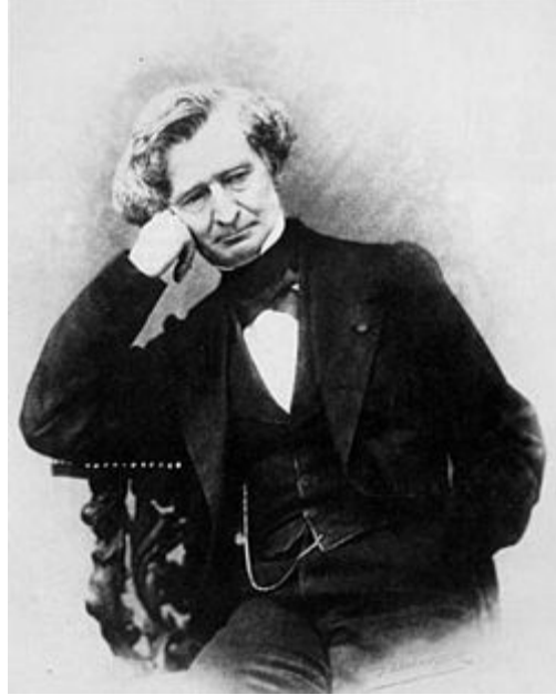
صورة هكتور برليوز (1) اخذت من بييري بتيّتام 1863 م (1)