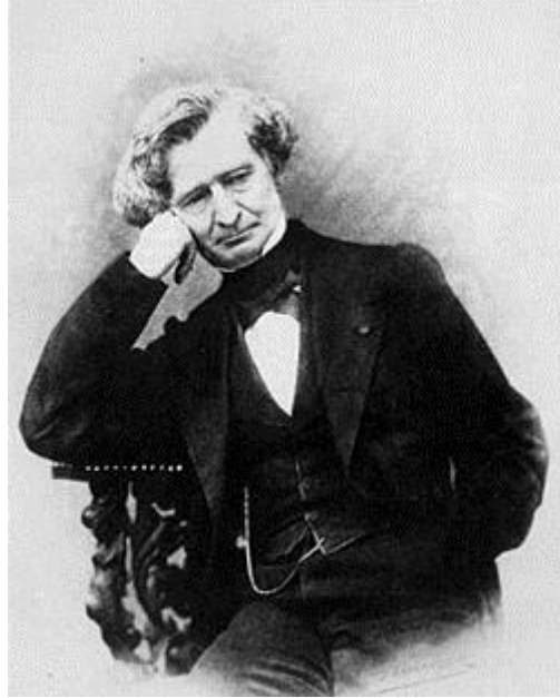
صورة هكتور برليوز (1) اخذت من بييري بتيّتام 1863 م (1)

الذي أظهر صدق التعبير عن الحدث. مستخدماً إمكانياته وعبقريته ذات النسيج اللحني المتناسكو الخصائص البوليفونية المُحكّمة (صدقي، 2014، classic composers). اتفقت الدراسة الحالية مع دراسة صدقي في تركيزها على الجانب التحليلي والوصفي للحدث الدرامي الموسيقي والشرح الافتتاحية واختلفت معها في العينة.